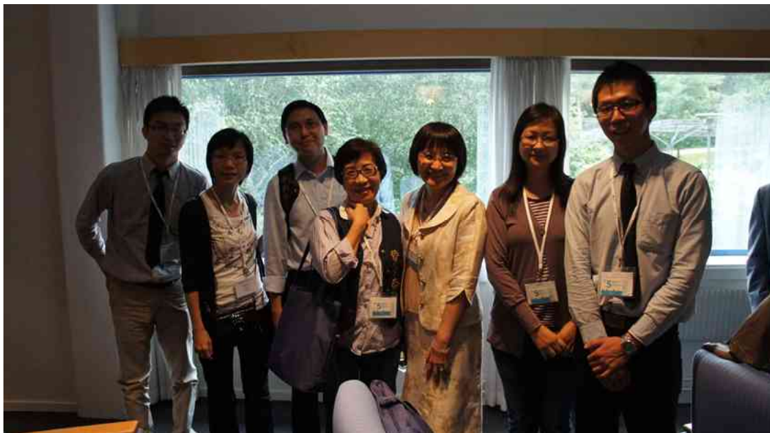
會議現場交換意見