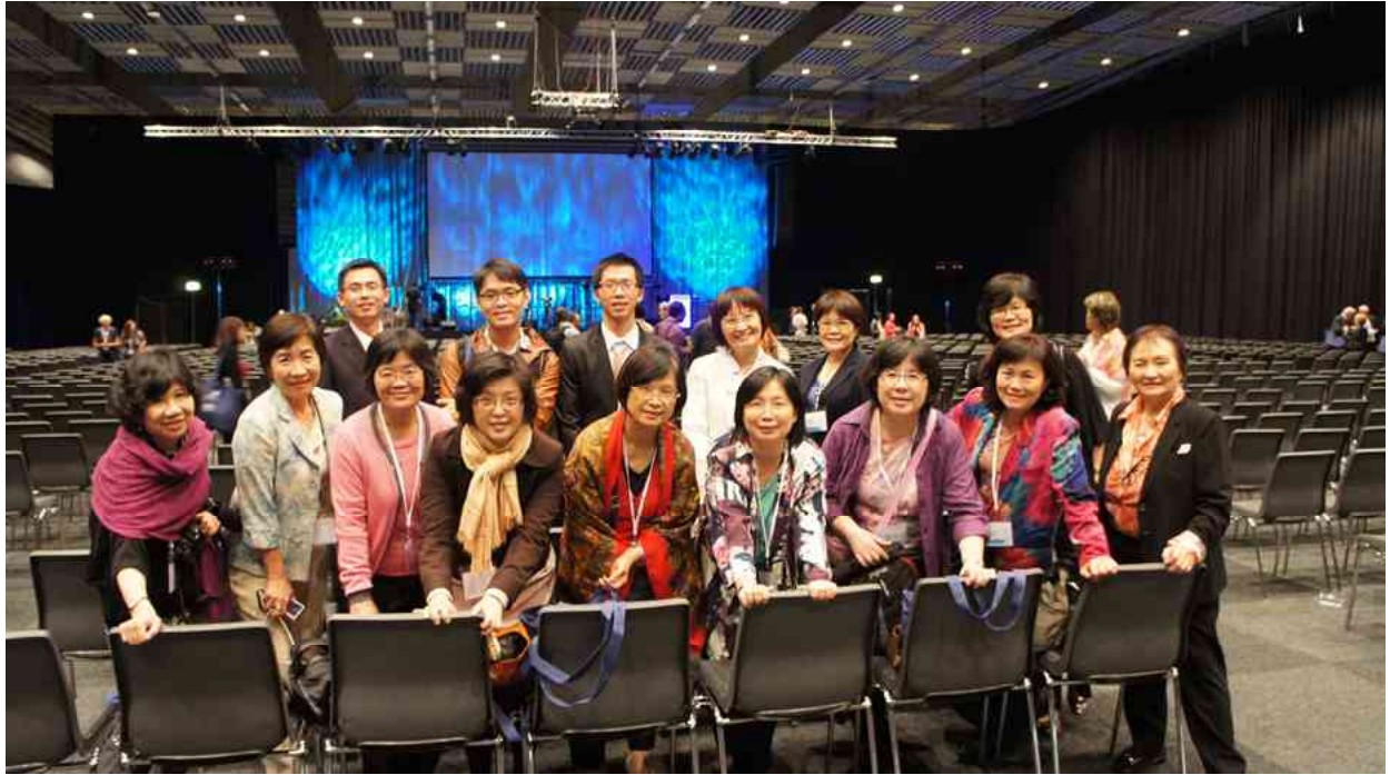
團員出席大會開幕