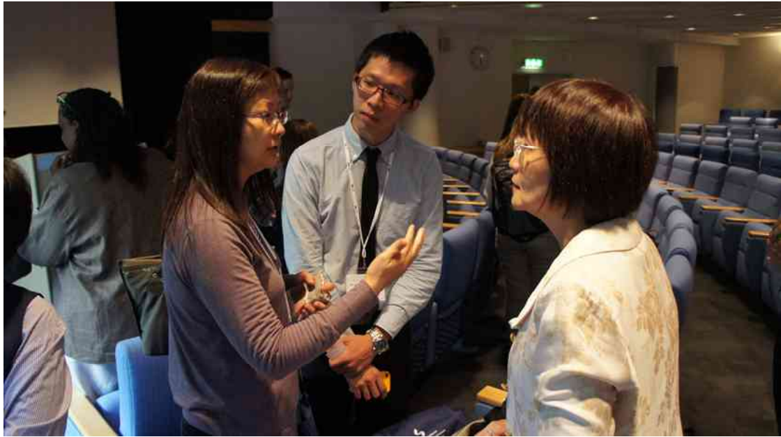
會議現場交換意見