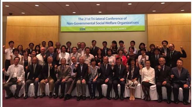
台日韓全體與會者合影