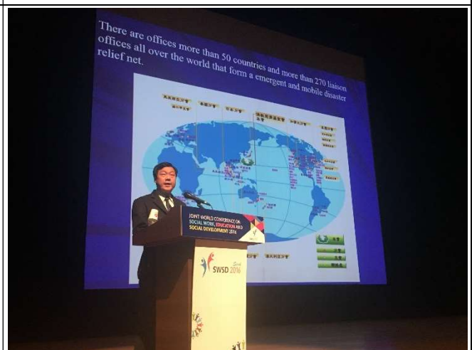
慈濟代表分享國際救災經驗