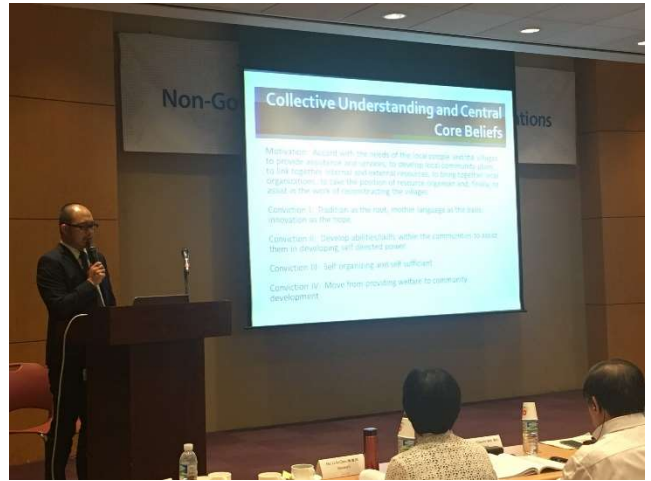
黃盈豪教授發表原住民社區營造研究