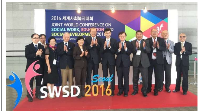
東北亞會議後與會者合影