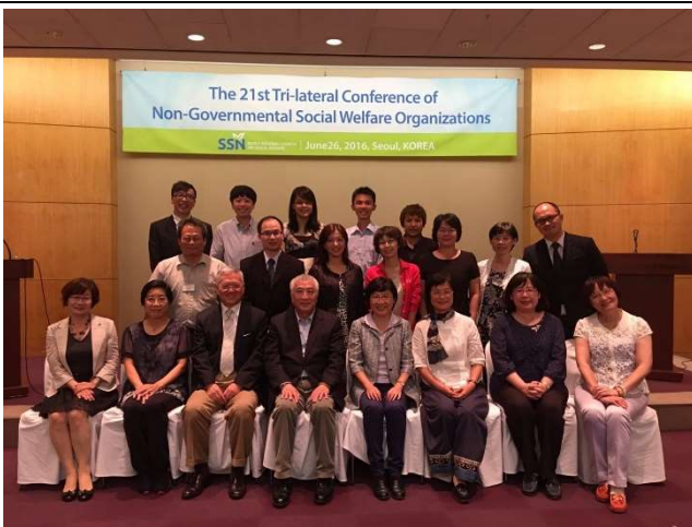
台灣全體與會者合影