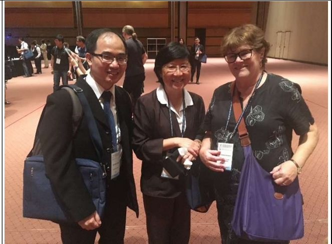
本會理事長、秘書長與 ICSW 總會長合影