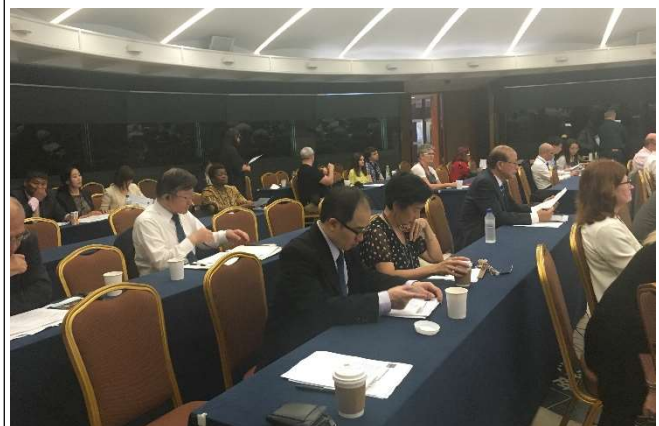
ICSW 國際會議議程進行