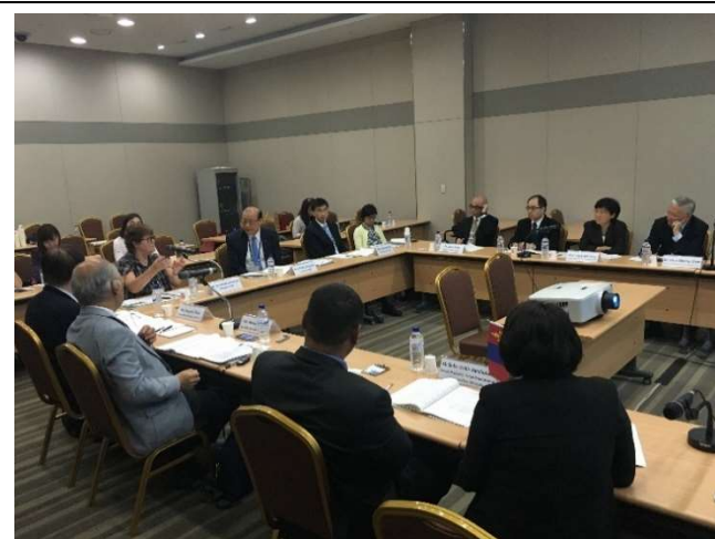
東北亞會議議程進行