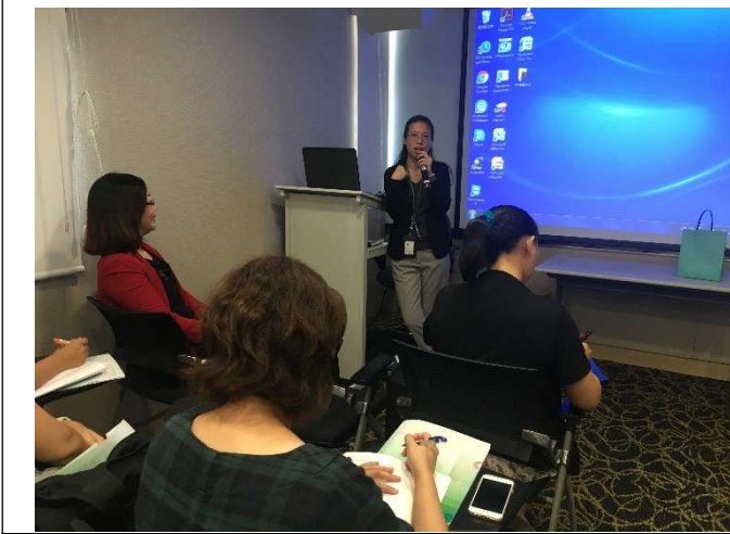
講師介紹失智症照護模式