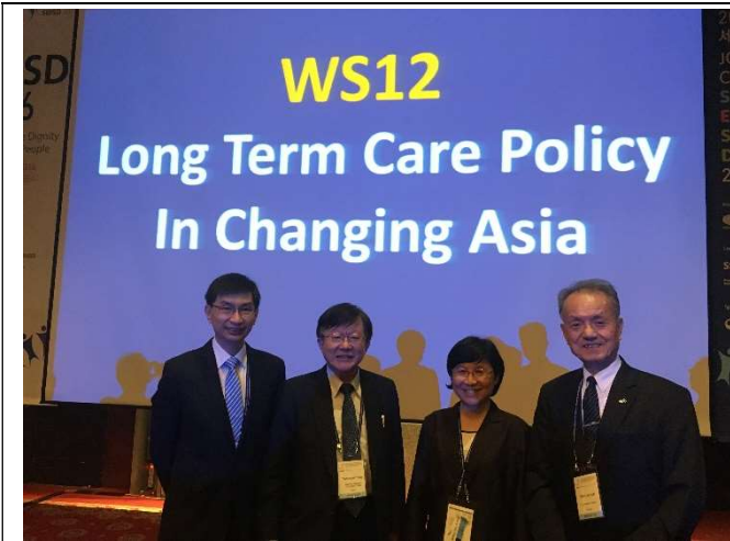
理事長與講者在長照論壇後合影