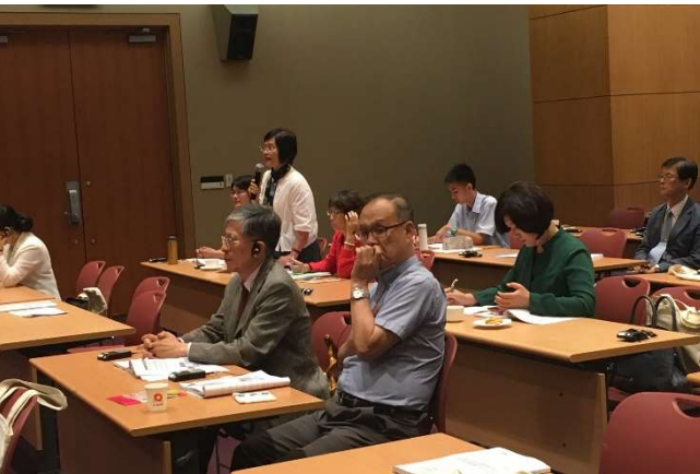
會場發問、交流踴躍