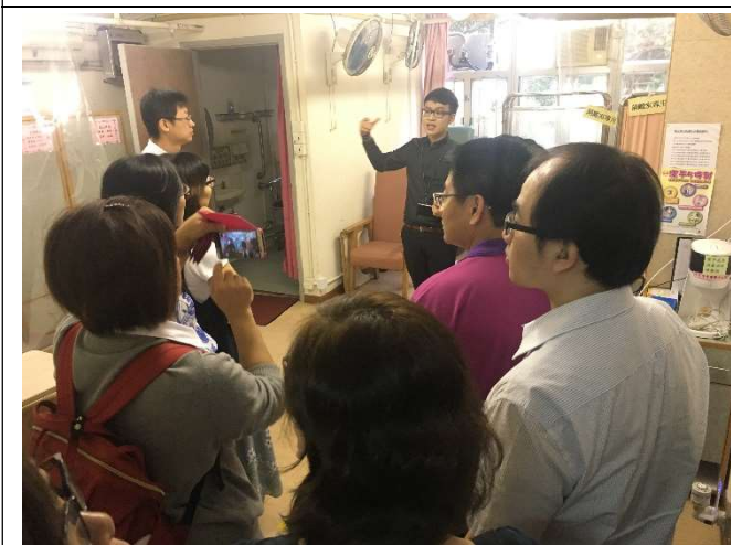
團員實地觀摩安老院設備