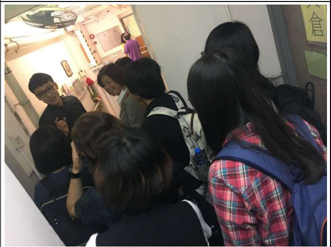
團員實地觀摩安老院設備