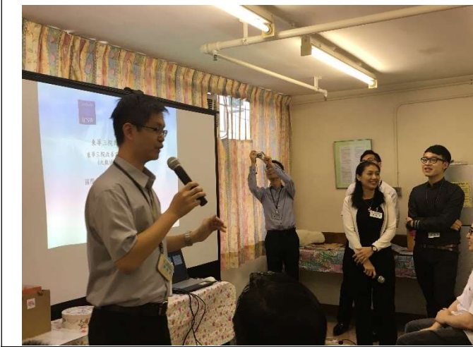
安老院黃主任發言