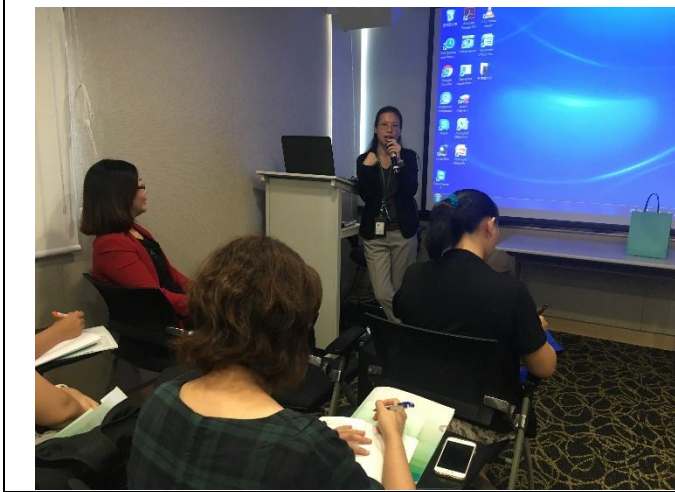
講師介紹失智症照護模式