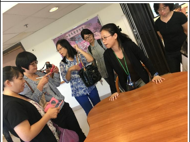
實地觀摩失智照護環境