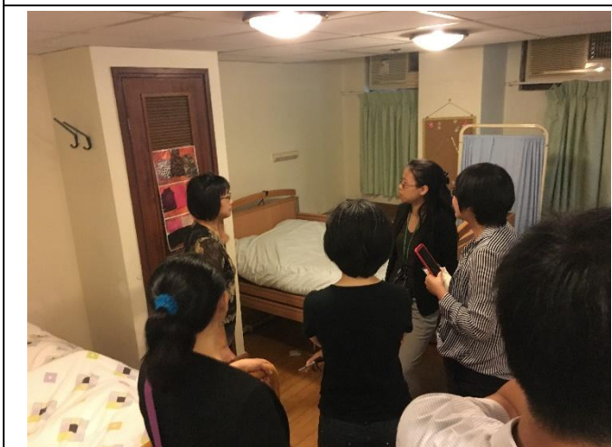
實地觀摩失智照護環境