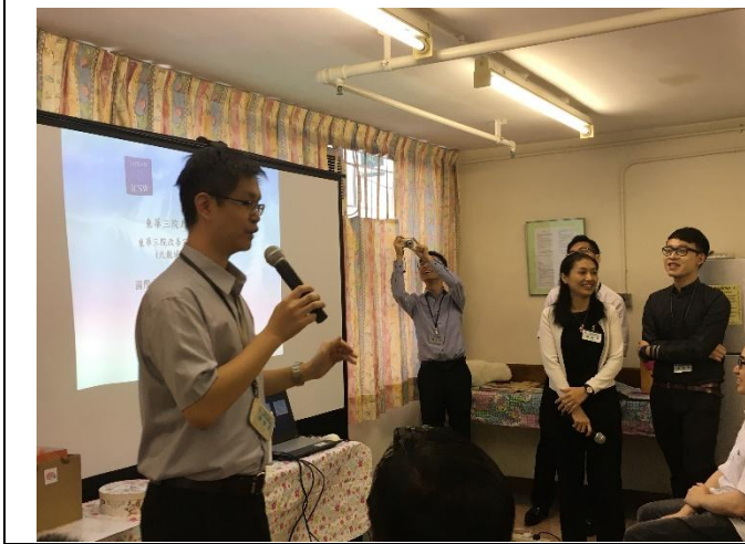
安老院黃主任發言