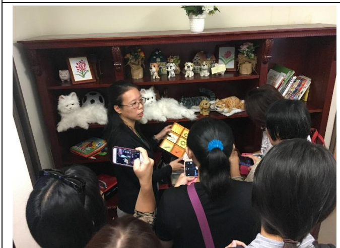
實地觀摩失智照護環境