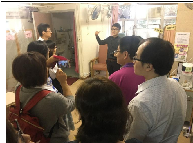
團員實地觀摩安老院設備