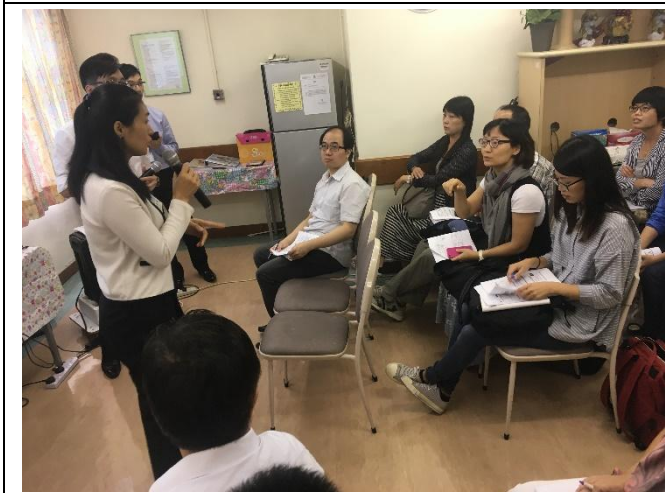
團員提問交流互動