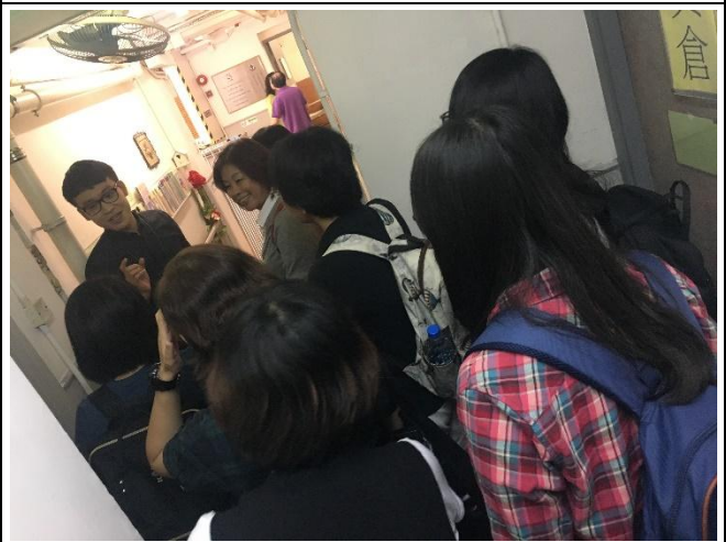
團員實地觀摩安老院設備